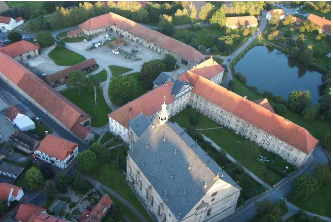
Kloster Lamspringe – the only English Monastery in Germany