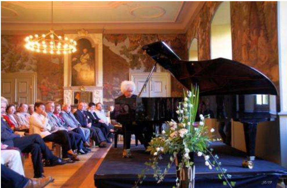
Klavierkonzert im Refektorium des Klosters Lamspringe, Lamspringer September