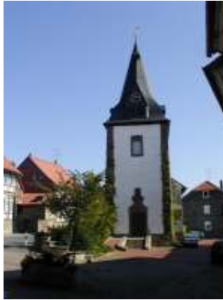
evangelische Sophienkirche, erbaut 1692